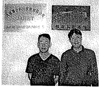
大連でシステム開発のパートナーと

の道場にも通い始める。柔道二段、空手初段の道場にも通い始める。柔道二段、空手初段